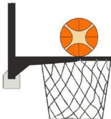
Figur 3 Ballen er i kontakt med ringen

31-19 Utsagn. Det er en overtredelse for ulovlig påvirkning av et skuddforsøk når en forsvars- eller angrepsspiller er i kontakt med kurven (ring eller nett) eller platen under et skuddforsøk mens ballen er i kontakt med ringen og fortsatt har sjanse til å gå i kurven.