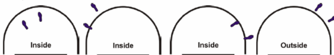
Figur 5: Spillerposisjon innenfor/utenfor chargingfritt område

33-4 Eksempel: A1 skyter et skuddforsøk som starter på utsiden av halvsirkelen som markerer det charging-frie området. A1 løper på (charger) B1 som er i kontakt med det charging-frie området.