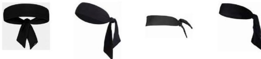
Figur 1 Eksempler på skjerfliknende hodeplagg

4-4 Utsagn. Det er ikke tillatt å bruke hodeplagg av typen skjerf som knytes.