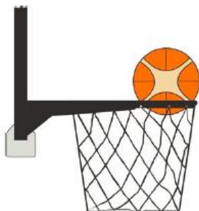
Figur 4 Ballen er i kurven

31-24 Utsagn. Det er ulovlig ballberøring hvis en forsvarsspiller berører ballen mens den er i kurven.